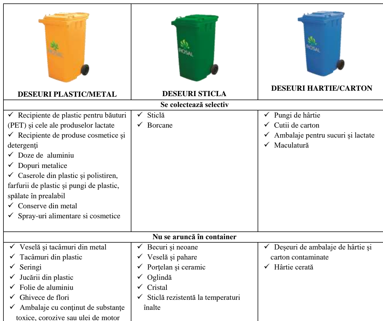
Table 1 Colectarea selectivă a deşeurilor reciclabile pe trei fracţii

Pentru a păstra curăţenia oraşului populaţia este rugată să nu depoziteze în containerele colorate alte deşeuri decât cele pentru care sunt prevăzute şi anume cele din tabelul de mai jos: