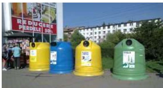
Figura 3 Recipiente de tip igloo pentru colectarea selectivă a deșeurilor reciclabile pe 3 fracții: hârtie/carton, plastic/metal și sticlă

Graficul de colectare al deșeurilor reciclabile este disponibil pe site-ul Rosal www.rosal.ro la secțiunea și pe site-ul Primăriei Municipiului Cluj-Napoca www.primariaclujnapoca.ro la secțiunea Salubritate - Program de ridicare deșeurii menajere și reciclabile Rosal Grup.